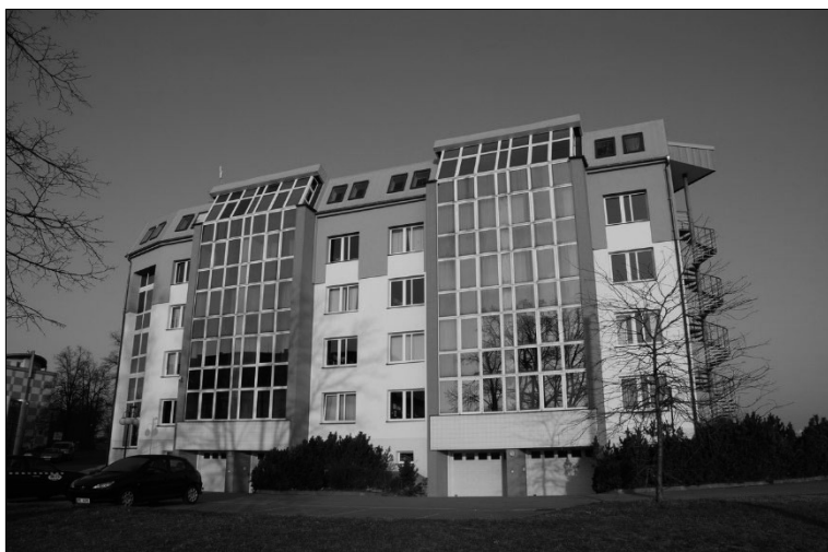
Budova NC | budova pedagogů kontakt na vrátnici +420 585 636 090