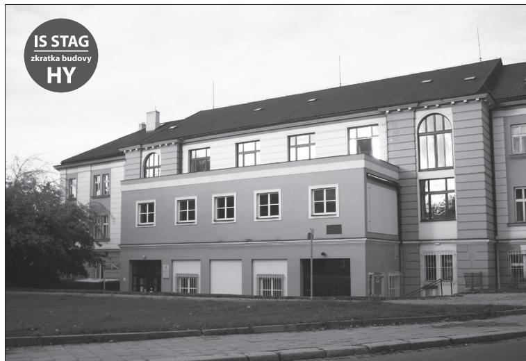
Budova HY | Budova Hynaisova | Hynaisova 9 | Olomouc kontakt na vrátnici: +420 585 636 520