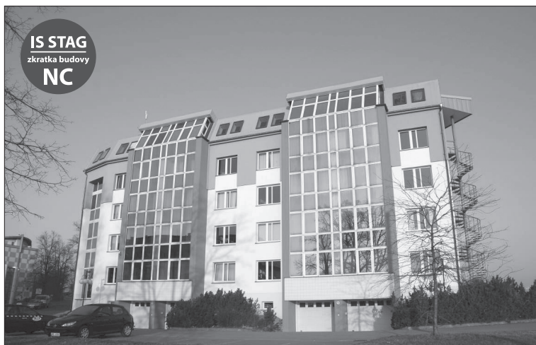
Budova NC | Budova pedagogů | kontakt na vrátnici: +420 585 636 090