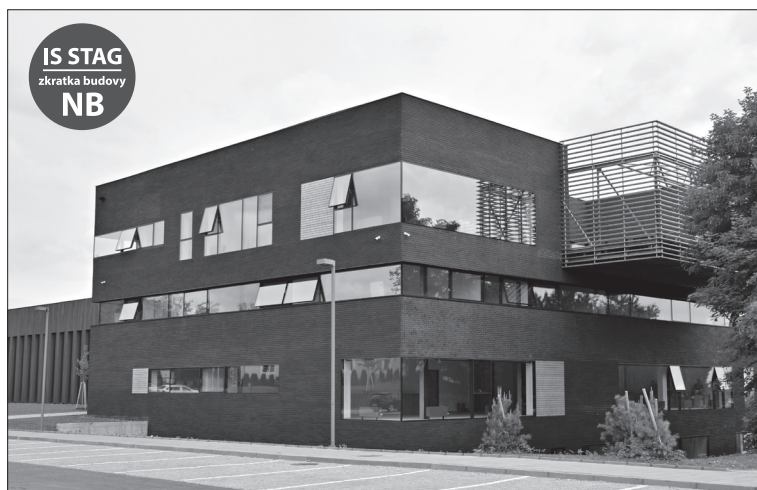
Budova NB | Budova center | Centrum kinantropologického výzkumu (CKV) kontakt na recepci Aplikačního centra BALUO: +420 585 636 710