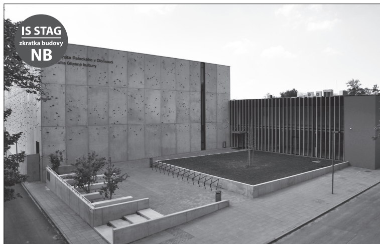
Budova NB | Budova center | Aplikační centrum BALUO (ACB) kontakt na recepci: +420 585 636 710 | www.acbaluo.cz